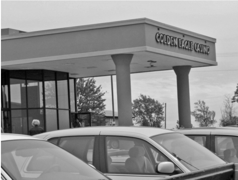
Foto 1. Golden Eagle Casino de la tribu kikapú de Kansas.