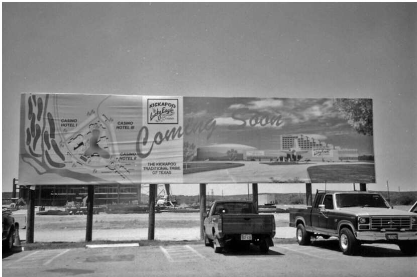
Foto 23. Plano de la hotelería del Kickapoo Lucky Eagle Casino en el área de estacionamiento del casino. Fotografía de Jesús Manuel Mager Hois, 2000.