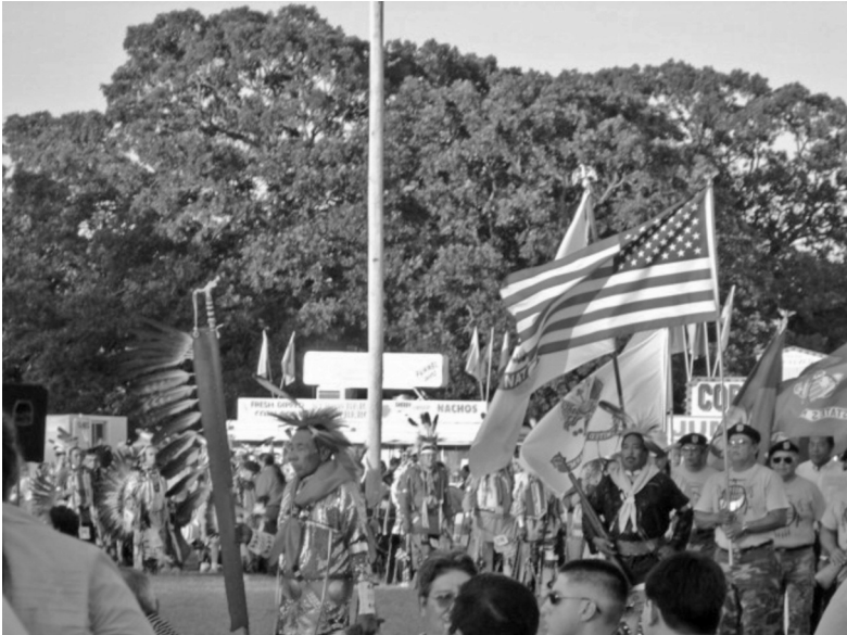
Foto 22. Powwow de los sauk/fox en Stroud, Oklahoma. Fotografía de Jesús Manuel Mager Hois, 2004.