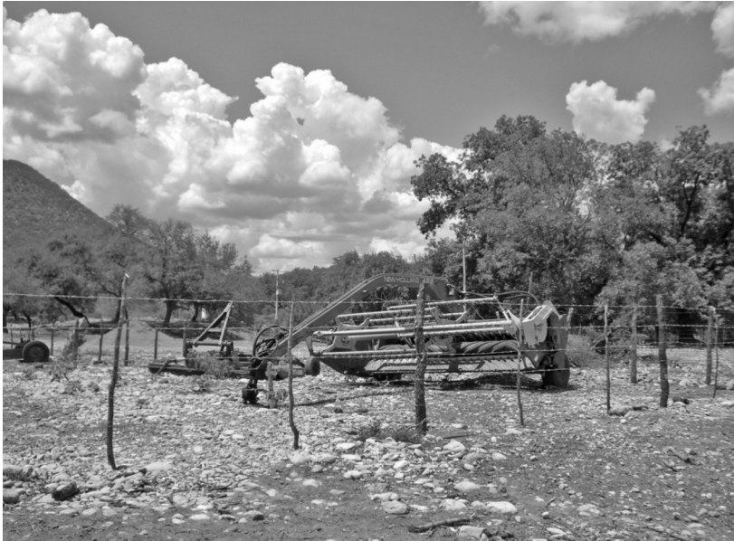
Foto 7. Maquinaria agrícola en El Nacimiento, otorgada por la cdi. Fotografía de Jesús Manuel Mager Hois, 2006.