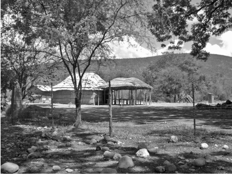
Foto 5. Casa de verano (utenikane) en El Nacimiento. Fotografía de Elisabeth Mager, 2006.