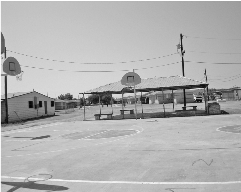
Foto 21. Plaza central de la reservación de la KTT. Fotografía de Elisabeth Mager, 2006.