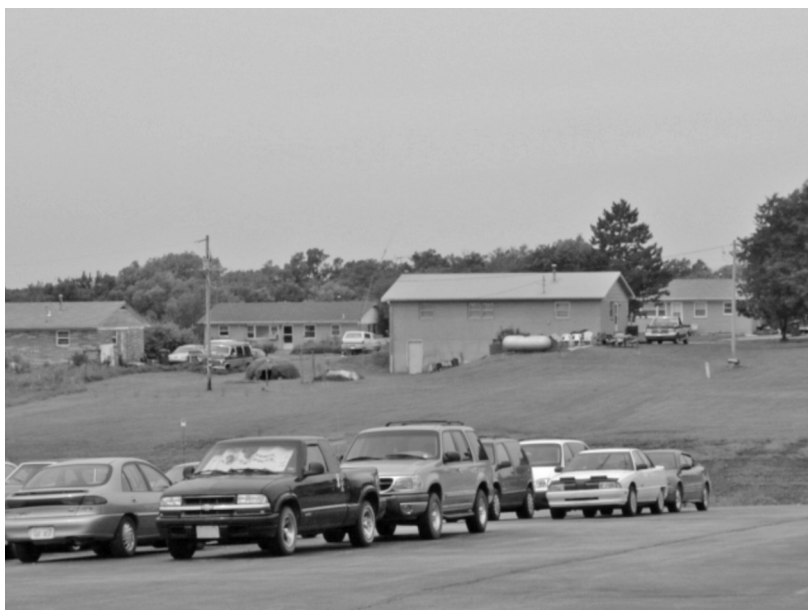
Foto 4. Casas en la reservación de la tribu kikapú de Kansas, cerca de Horton. Fotografía de Elisabeth Mager, 2004.