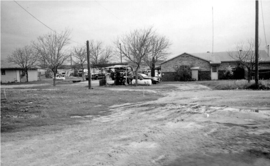
Foto 20. Casas en las afueras de la reservación. Fotografía de Elisabeth Mager, 2005.