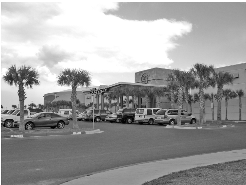
Foto 3. Kickapoo Lucky Eagle Casino. Fotografía de Elisabeth Mager, 2005.