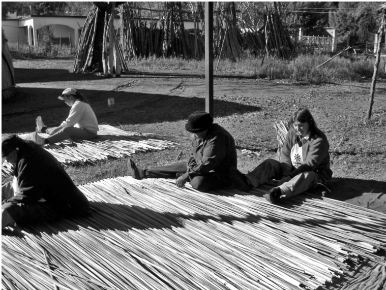
Foto 8. Mujeres tejiendo tules para la casa de verano. Fotografía de Jesús Manuel Mager Hois, 2006.