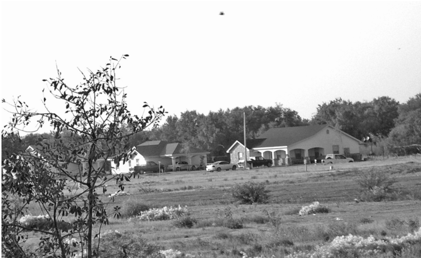
Foto 19. Casas de la Pecan Farm en el fondo.