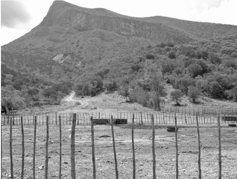
Foto 6. El Rancho de la Máquina, adquirido por la КТТТ en El Nacimiento. Fotografía de Elisabeth Mager, 2008.