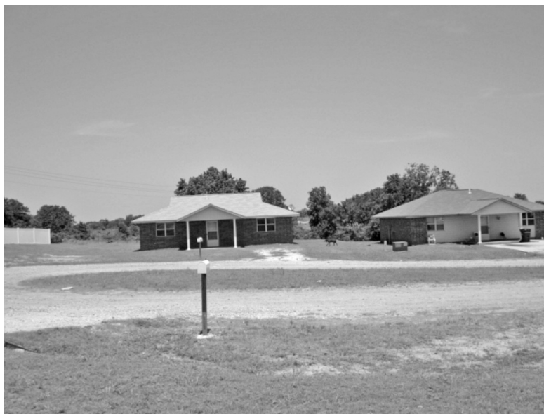
Foto 15. Casas en el Centro Comunitario de Oklahoma. Fotografía de Elisabeth Mager, 2004.