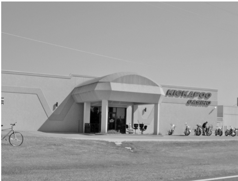
Foto 2. Kickapoo Casino cerca de McCloud, Oklahoma. Fotografía de Jesús Manuel Mager Hois, 2005.

* Todas las fotografías, salvo la foto 22, pertenecen al acervo personal de la autora.