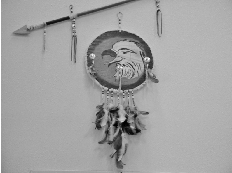
Foto 16. Escudo de la Kickapoo Traditional Tribe of Texas. Fotografía de Elisabeth Mager, 2002.