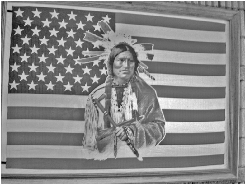
Foto 17. Cuadro del Centro Comunitario de la reservación de la KTTT. Fotografía de Jesús Manuel Mager Hois, 2005.