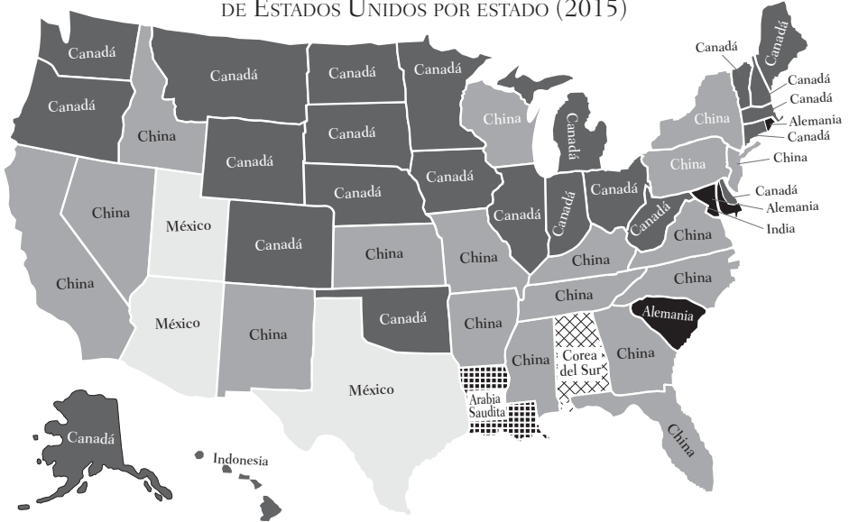
MAPA 1 PRINCIPAL PAÍS DE DONDE SE DERIVAN LAS IMPORTACIONES DE ESTADOS UNIDOS POR ESTADO (2015)