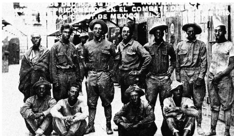
FUENTE: Gerald Horne, Black and Brown. African Americans and the Mexican Revolution (Nueva York: New York University Press, 2005), 145.

Es notorio, en los informes de los representantes de la Secretaría de Gobernación en los puestos fronterizos con Estados Unidos conservados en el Archivo Histórico del Instituto Nacional de Migración cómo aparecen y se acumulan las demandas de afroamericanos que, solicitando su ingreso a territorio nacional por diversos motivos, que van desde lo referido a las relaciones familiares, hasta permisos de trabajo temporal (por ejemplo, los músicos que cruzan la frontera para tocar en diversos sitios de entretenimiento), son objeto de rechazo y, ya en 1925, de negaciones explícitas de ingreso basadas en una supuesta “restricción para inmigrantes negros”. 35 En ese mismo año, la solicitud de internación a Chetumal de un grupo de trescientos trabajadores beliceños negros contratados por una empresa maderera desató un intenso debate entre las autoridades de Gobernación que la negaron, lo que en opinión del delegado fronterizo era injusto, dado el valor que daban al desarrollo, por lo que debían ser admitidos. El diferendo se llevó al escritorio presidencial de Plutarco Elías Calles el 6 de marzo de 1926, quien veinte días después rechazó la admisión solicitada