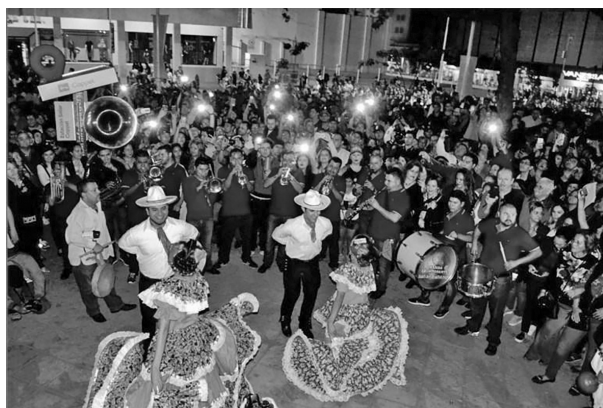
IMAGEN 2 CALLEJONEADA POR LA SERIE DEL CARIBE 2017

de este tipo de actividades. Además, se suman dos asuntos pendientes de concretar: la creación de más corredores turísticos y culturales, para asegurar que el centro histórico permanezca activo; el segundo asunto es la movilidad urbana del primer cuadro de la ciudad: si bien se realizaron modificaciones en el flujo vehicular con el fin de volver de un solo sentido (Proyecto “Par Vial”) la avenida Álvaro Obregón, principal vía de acceso al centro histórico, ello no ha resuelto los problemas de congestión vial, sino al contrario, ha provocado el malestar de personas que diariamente transitan a pie por esa avenida y de los habitantes de algunas zonas residenciales que aseguran que el exceso de tráfico de camiones urbanos crea caos (Ibarra, 2016).