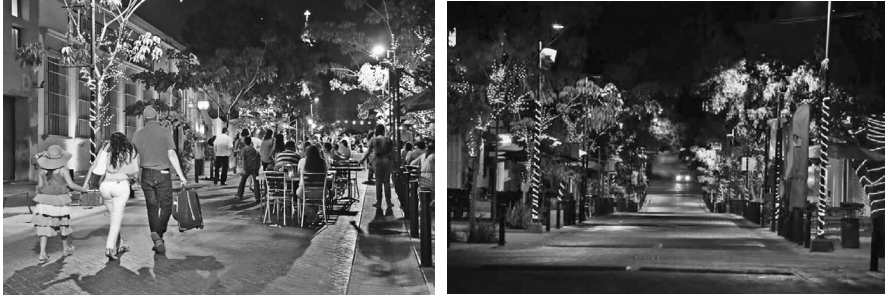
IMAGEN 1 VISTA DEL PASEO DEL ÁNGEL

estampado y banquetas de adoquín, se introduciría cableado subterráneo, se instalarían módulos de información, se impulsaría la inversión de negocios de entretenimiento y ocio, asimismo se establecería un sistema de seguridad de patrullaje y videovigilancia (imagen 1).