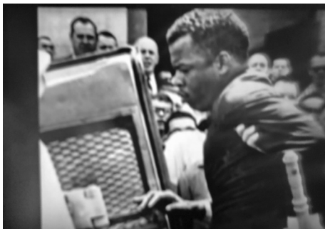
Fotogramas del documental The Shadow of Hate (1995).