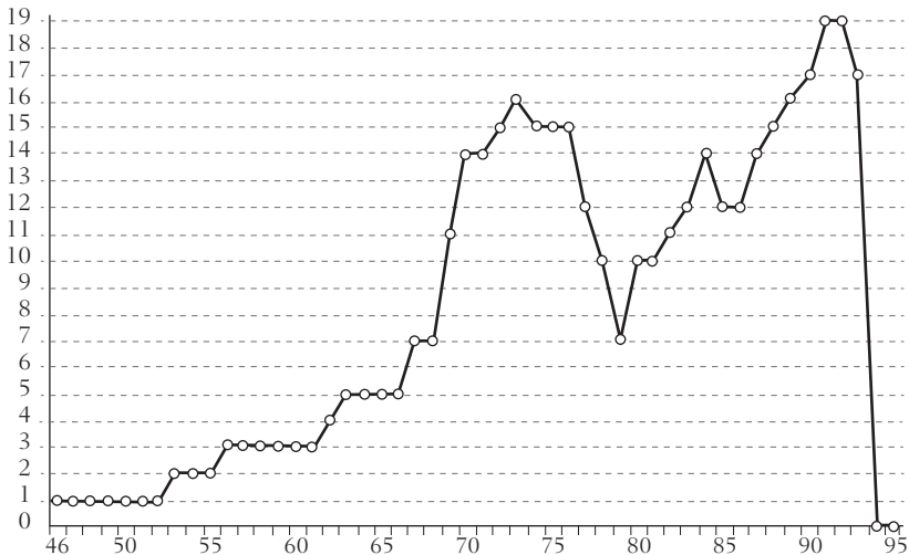
GRÁFICA 1 OFICINAS INTERNACIONALES DE ONTARIO, 1946-1993

Como se observa en la gráfica 1, Ontario promovió una considerable actividad internacional en el periodo 1946-1993. El número de sus representaciones internacionales se incrementó durante los setenta y ochenta del siglo xx, alcanzando su cúspide hacia principios de los noventa; sin embargo, en 1993 las cerraron todas. Actualmente, esta provincia opera sus oficinas dentro de las embajadas de Canadá, como en el caso de México.