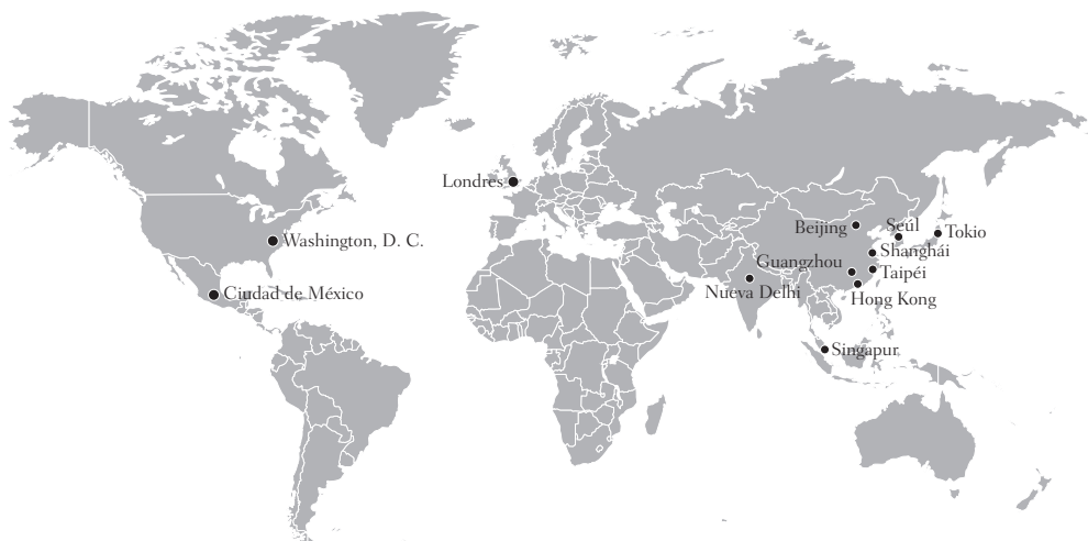
MAPA 2 OFICINAS DE ALBERTA EN EL EXTRANJERO