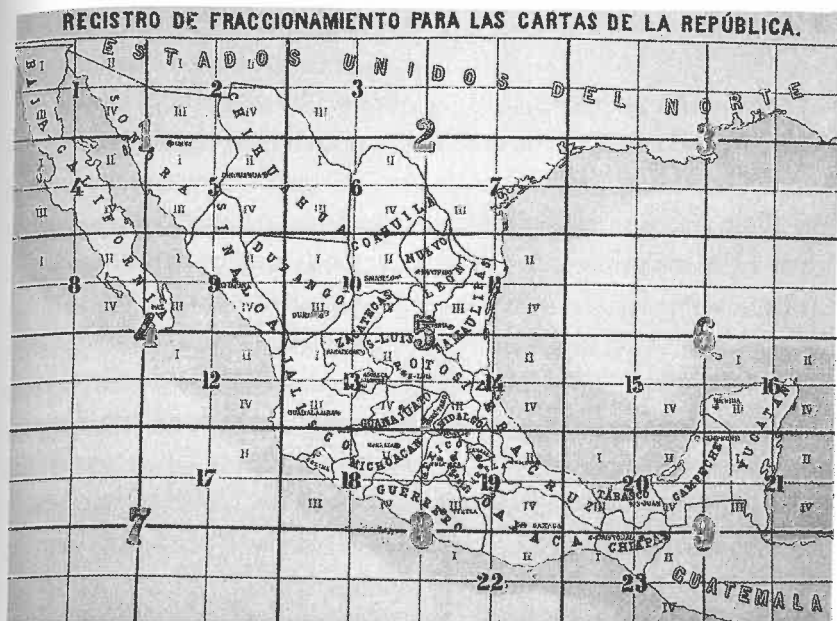
Figura 7. Fracciones: Comisión Geográfico-Exploradora, Registro de fraccionamiento para las cartas de la República , 1877.

simple providencia, podrá ser eficaz". 15 El gobierno ya no dependería de una selección dispersa de mapas conflictivos y plagados de errores, llenos de coordenadas geográficas incommensurables y una nomenclatura imprecisa de los lugares. Tampoco se vería obligado a basarse sólo en la dudosa información enviada irregularmente por las autoridades locales, que arruinaban cualquier intento de reconfigurar racionalmente el paisaje administrativo. Finalmente, los mapas también tenían un gran potencial militar. Efectivamente, la CGE se convirtió en el principal organismo que produjo mapas generales para operativos militares elaborados a modo de que "a la simple vista pueda el Ministerio cambiarlos [a los soldados] de situación o dictar órdenes de operaciones". 16